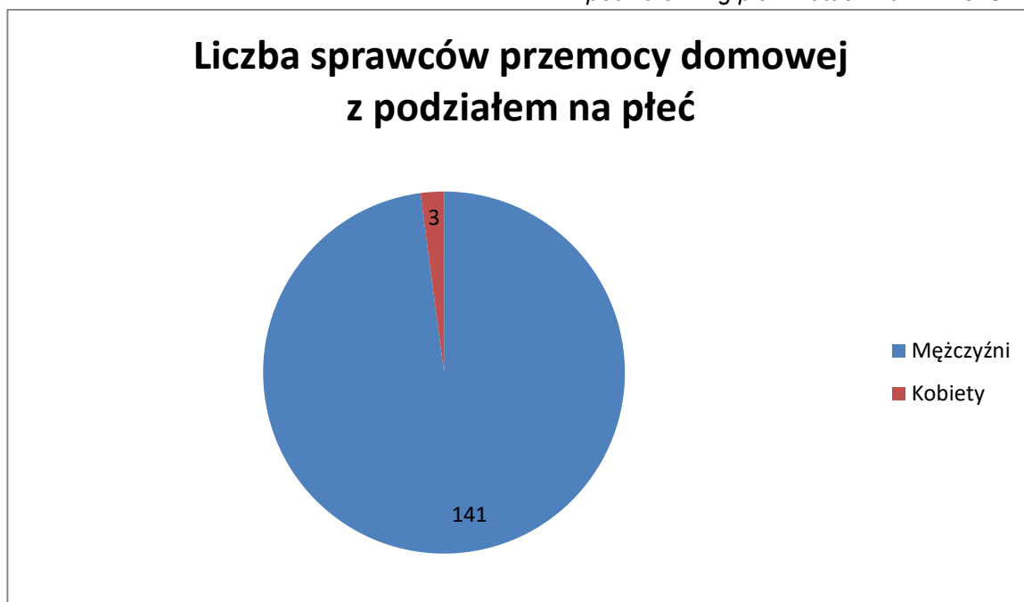
Wykres nr 2 Liczba sprawców przemocy domowej z podziałem wg płci w latach 2014 - 2016

Źródło: opracowanie własne na podstawie danych Komendy Miejskiej Policji w Koszalinie